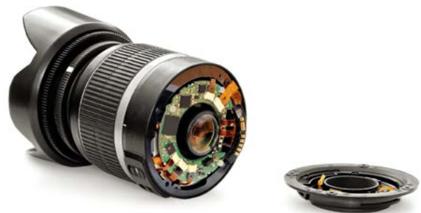
Bild 1: Die Digitalisierung erlaubt eine weit engere Verbindung zwischen optischen, elektronischen und mechanischen Funktionsebenen, als dies bislang der Fall war, hier am Beispiel eines Objektivs.

Digitalisierung der Technik bezeichnet die Ergänzung und Erweiterung der Technik mit elektronischer Datenverarbeitung in nahezu allen Anwendungsbereichen. Ob in Fernseher, Radio, der Waschmaschine oder dem Automobil, nahezu überall in unserer Alltagstechnik und in noch weit höherem Maße in der industriellen Anlagen- und Produktionstechnik verrichten zahllose Mikroprozessoren ihren Dienst. Der wesentliche Mehrwert der eingebetteten Mikroelektronik liegt sowohl in der Automatisierung von Einstell-, Regelungs-, Auswertungs- und Überwachungsaufgaben als auch einer enormen Erhöhung des Funktionsumfangs technischer Geräte.