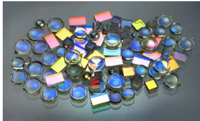
Bild 1: Licht für die verschiedensten Anwendungen maßschneidern – darum geht es in der Fördermaßnahme „Photonik nach Maß“.

Die langfristige Zielsetzung liegt darin, das Licht maßgeschneidert auf nahezu jede erdenkliche Art formen und lenken zu können. Gleichzeitig sollten die Optikkomponenten einen minimalen Bauraum einnehmen und zu möglichst geringen Kosten produzierbar sein. Letztlich gilt es, Komponenten und Bauelemente in einem ganzheitlichen Design zusammenzuführen. Die Bekanntmachung „Photonik nach Maß – Funktionalisierte Materialien und Komponenten für optische Systeme der nächsten Generation“ verfolgt das Ziel, diese Entwicklung zu unterstützen und Unternehmen in Deutschland dazu zubefähigen, die vorhandenen hervorragenden Kompetenzen zu einer anhaltenden, weltweiten Marktführerschaft auszubauen.